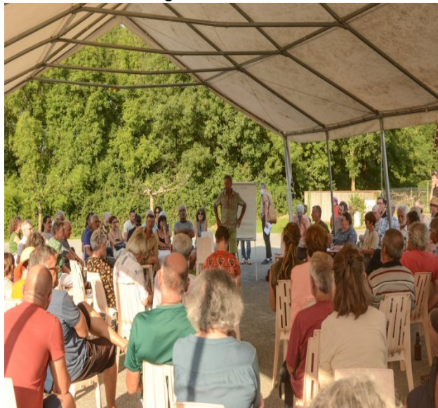
Le 27 juillet, une centaine de personnes s'est réunie à Capvern, commune voisine de Lannemezan, pour structurer un peu plus le collectif Touche pas à ma forêt et commencer à organiser une grande marche prévue les 10 et 11 octobre dans l'ensemble des Pyrénées.

Ce programme politique est donc relayé par la région Occitanie, qui par des appels à manifestation d'intérêts, souhaite encourager des projets dans la filière bois. C'est dans ce cadre-là que l'intercommunalité du Plateau de Lannemezan a souhaité porter le projet Florian, afin de créer de la « valeur » et des emplois sur son territoire. Selon la charte officialisant le soutien à l'entreprise italienne, signée par les pouvoirs publics le 16 décembre 2019, l'installation de la scierie devrait permettre « la création directe de 25 emplois » et « induirait la création de plus de cent emplois supplémentaires dans la filière bois régionale ».