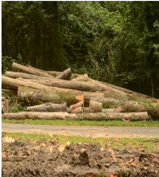
Un dépôt de bois dans la forêt d'Issaux, dans les Pyrénées-Atlantiques.